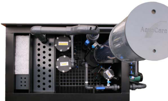
Aufsicht Basic 400, optional mit ACF3000V-170, FBR110-060, AK110-060, ADN75, Kreislaufpumpe, Abschäumpumpe.

Prinzipiell können die PE- Basic -Filtersysteme in allen Größen gefertigt werden. Da der Aufwand erheblich größer ist als bei z.B. Glasfilterbecken lohnt sich eine solche Anschaffung aber erst ab ca. 1000-Liter-Aquarien. Nach oben sind keine Grenzen gesetzt. Ab einer bestimmten Größe werden die PE-Becken mit einem eingeschweißten Stahlrahmen verstärkt, um die enormen Kräfte des Wasser standzuhalten.