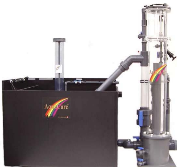
Filtersystem Basic 750 aus PE mit optional angebaurem Abschäumer ACF6000V und eingebautem Fließbettfilter FBR 110-130

www.aquacare.de • e-mail: info@aquacare.de