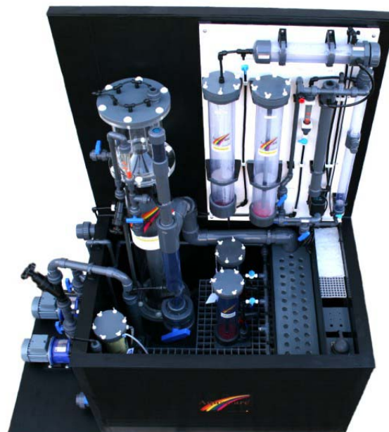
Filtersystem Basic 750 aus PE mit optional eingebautem Abschäumer ACF6000, Turbo -Kalkreaktor Größe 4, Aktivkohlefilter AK100-060, Denitrifikationsfilter ADN110-060, Phosphatfilter PMR110-060, Heizstab 750 W, 2 x Pumpe MX400