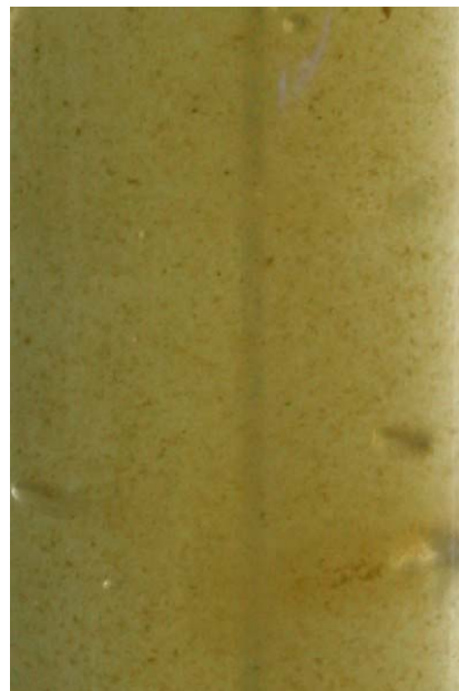
Eine Brachionus plicatilis -Kultur, gefüttert mit Nannochloropsis salina mit vollständiger Durchmischung (Luft eintrag unten): das Medium ist sehr trübe durch den produzierten Detritus (Futterrest, Fäces der Rädertierchen, Tierleichen)

Luftzufuhr auf die etwas höhere Position umgeleitet.