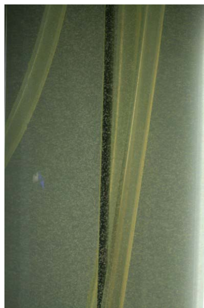
Die gleichen Bedingungen jedoch mit nicht vollständiger Durchmischung (Luft eintrag ca. 5 cm über dem Konus): die weißen Pünktchen sind Brachionus , es sind kaum Fremdstoffe im Freiwasser. Der Detritus kann im Konus regelmäßig abgesaugt werden. Die Trennung Kultur - Detritus funktioniert nur mit Algen, die sehr schlecht sedimentieren, z.B. Nannochloropsis salina .