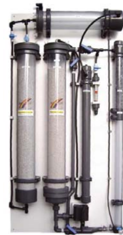
Kalkreaktoren (hier AquaCare Turbo-Kalkreaktor 5 mit Magnesiumumrohr) reichern das Wasser mit Kohlendioxid an, dass den pH-Wert senkt. Ohne Abschäumer entstehen hohe Risiken.

aquarium oft mit zu viel CO 2 versorgt, das leicht übermäßiges Algenwachstum oder gar einen pH-Sturz auslösen kann. Zwar gibt es schon Modell die bis zu 80% weniger CO 2 in das Wasser einbringen ( Turbo-Kalkreaktor ), aber das verbleibende CO 2 muss aus dem Wasser gebracht werden.