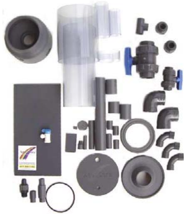
Einzelteile des AquaCareFlotors 1000V

Das wesentlich schlagzähere PVC (gibt es in grau und transparent) ist nur schwer kaputt zu kriegen und sollte im rauen Aquaristikalltag (wie schnell fällt ein Flotatopf mal auf den Boden!) bevorzugt eingesetzt werden. Außerdem kann eine Reparatur von PVC vom Aquarianer selber vorgenommen werden. AquaCare verwendet bei Kalkreaktoren, Nitratfiltern, Kalkwasserreaktoren und Kleinabschäumern bis Größe 3000 und bei Großabschäumern ab Größe 30.000 graues und transparentes PVC; bei den Abschäumer der Größe 6000 bis 16000 besteht das Hauptrohr und Abschäumertopf aus PMMA, der Rest hingegen wiederum aus PVC. Selbstverständlich sind die