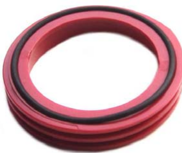
Große Trapezgewinde halten den rauen Aquarianerbedingungen sehr gut stand -ein eingelegter O-Ring dichtet einfach und perfekt den Topf vom Hauptrohr ab.

Der Punkt Wartung ist bei allen Geräten ein leicht übersehener Faktor. Nur Geräte die leicht gewartet werden können, werden auch gewartet. Kompliziert zu reinigende Anlage werden oft vernachlässigt, verdrecken und lassen stark in ihrer Leistung nach. Die Leittragenden sind immer die Aquariumtiere.