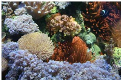
Traumhafte Meerwasseraquarien sind ohne Abschäumer nur sehr schwer möglich.

Die Leistung verschiedener Abschäumer zu vergleichen, ist wohl das schwierigste oder auch das teuerste Unterfangen, das man sich vorstellen kann. Eine absolute Aussage kann nur mit einem Test getroffen werden, bei dem die zu vergleichenden Abschäumer an ein und demselben System gleichzeitig angeschlossen werden. Der Testsieger schäumt am längsten und nimmt den anderen mehr oder weniger die abschäumbaren Substanzen vor der Nase weg. Der finanzielle Aufwand für einen umfassenden Test ist augenscheinlich und kann deswegen weder von Herstellern (die Branche ist extrem klein verglichen mit z.B. High-Fi- oder Photobranche, die regelmäßig Test durchführen können), noch vom Zoofachmarkt oder gar vom Aquarianer durchgeführt werden.