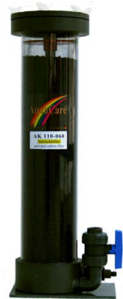
Aktivkohlefilter AK 110-060

AquaCare GmbH & Co. KG Am Wiesenbusch 11 - D-45966 Gladbeck - Germany ☎ +49 - 20 43 - 37 57 58-0 • 📠 +49 - 20 43 - 37 57 58-90 www.aquacare.de • e-mail: info@aquacare.de