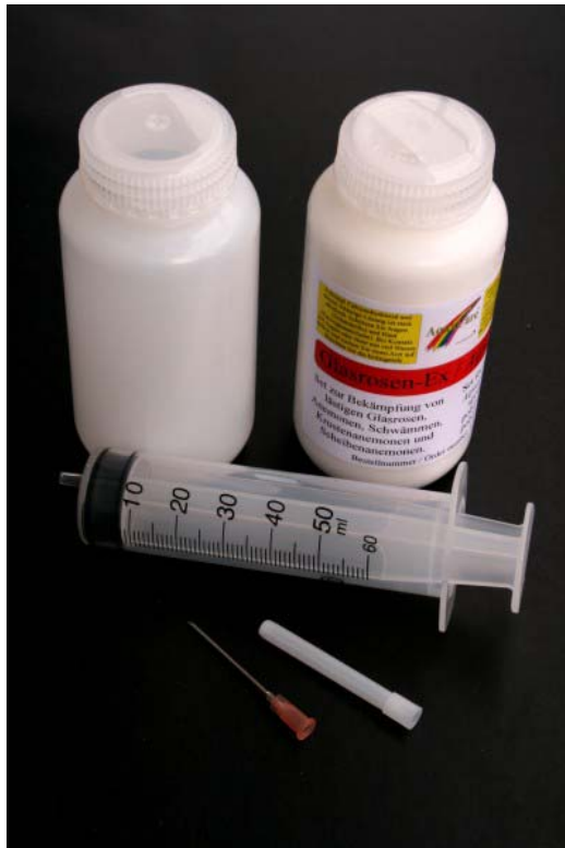
Glasrosen-Ex: ein Set bestehend aus Mischbehälter, Spritze mit großer Kanüle, Calciumhydroxidpulver, Anleitung Bestellnummer: EX-001

AquaCare GmbH & Co. KG Am Wiesenbusch 11 • D-45966 Gladbeck • Germany ☎ 0 20 43 - 37 57 58-0 • 📠 0 20 43 - 37 57 58-90 www.aquacare.de • info@aquacare.de