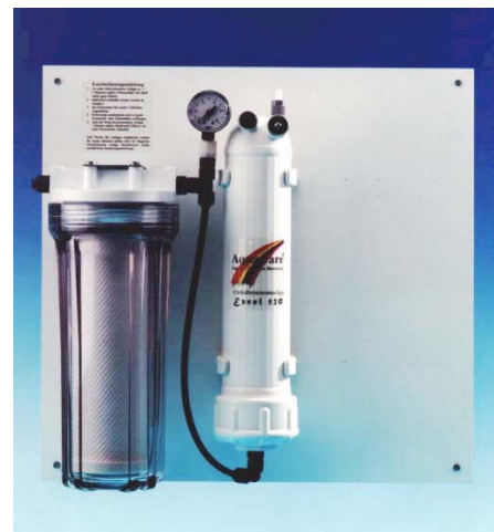
Excel 160 mit Manometer, Klarsichtgehäuse und Montageplatte

Das Modell Excel ist auf einer weißen Montageplatte montiert. Der 10" Kombifilter hat ein großes Volumen und kann auf Wunsch mit Klarsichtgehäuse geliefert werden. Serienmäßig ist ein Manometer installiert. Es ist genügend Platz für Erweiterungen oder Automatisierungen vorhanden. In den laufenden Kosten ist die Anlage günstiger als das Modell Classic , weil einerseits